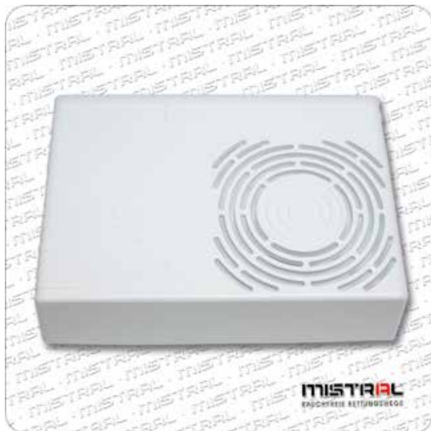
Akustischer Signalgeber SP 205