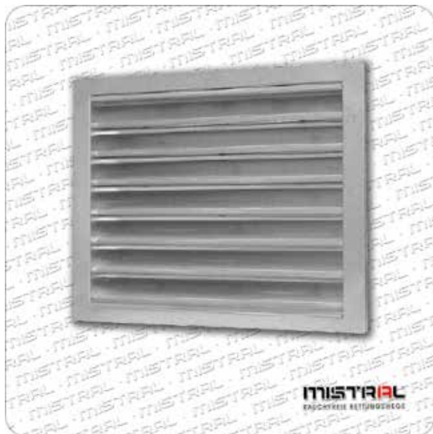
Wetterschutzgitter WSG A/B/H