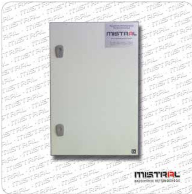
RVA-Steuereinheit RVA-SE PST1 1V 4kW